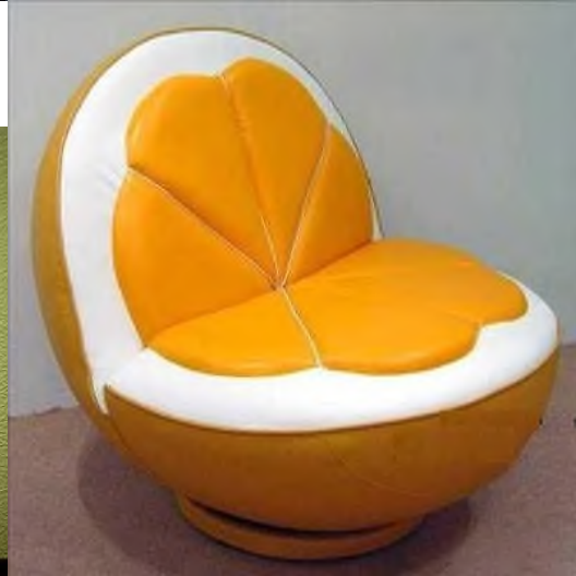
4.Современные предметы быта (например, посуда, светильники, мебель).