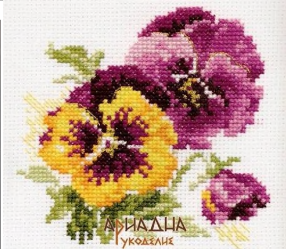
6. Изделия декоративно-прикладного искусства (например, глиняные игрушки, хохломская или гжельская посуда, кружева).