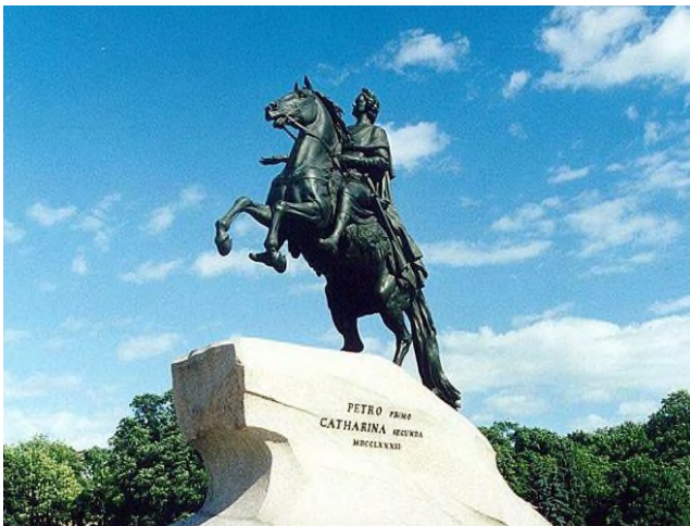
10. Э.М. Фальконе. Памятник Петру I в Санкт-Петербурге