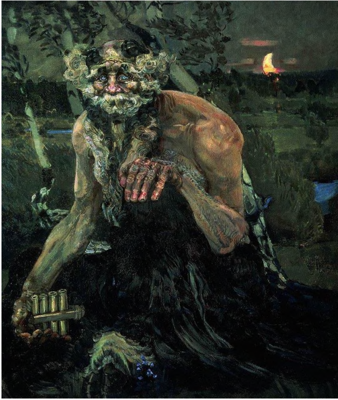
7. М. А. Врубель. Пан.