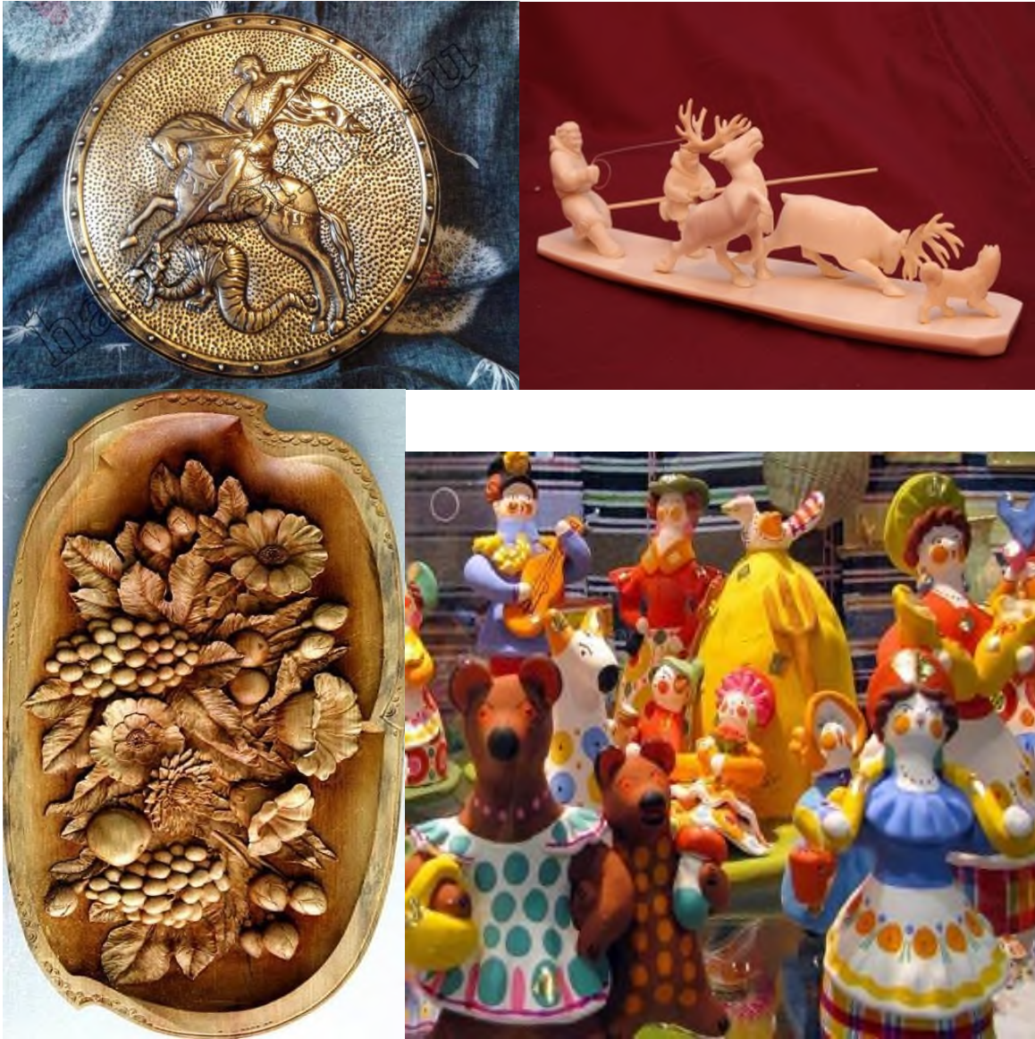
9. Изделия декоративно-прикладного искусства (например, гобелен, чеканка, резьба по дереву или по кости, филимоновская или дымковская игрушка).