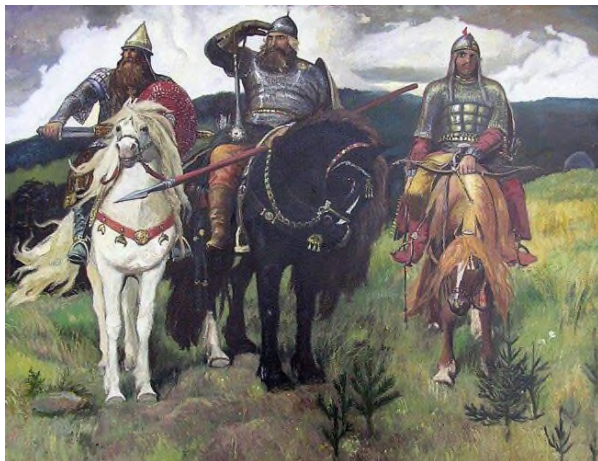
3. В. Васнецов. Богатыри