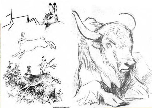
5.В. А. Ватагин. Рисунки животных.