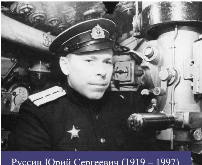
Руссин Юрий Сергеевич (1919 – 1997)

19 сентября наша школа сделала важный шаг, присоединившись к Всероссийскому образовательному проекту «Парта Героя». Этот проект направлен на сохранение памяти о подвигах и заслугах выдающихся граждан нашей страны.