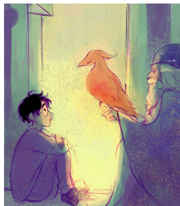
Гарри Поттер и Альбус Дамблдор

Альбус Дамблдор, директор Хогвартса, стал для Гарри мудрым наставником и защитником. Он не только передавал ему знания о магии и о том, как противостоять злу, но и обучал начинающего волшебника важным урокам о дружбе и смелости.